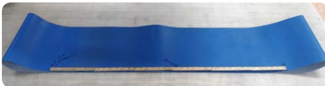
Bild 3 - Uppmätning av längden .....

Lägg mätverktyget längs med bandets underkant.