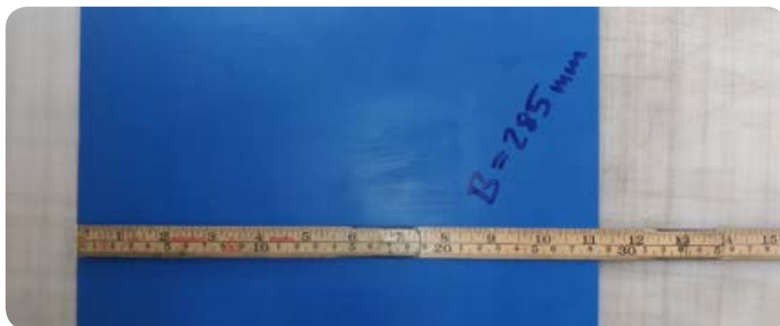
Bild 2 - Uppmätning av bredden .....

Lägg mätverktyget tvärs över bandet och läs av bredden i millimeter.