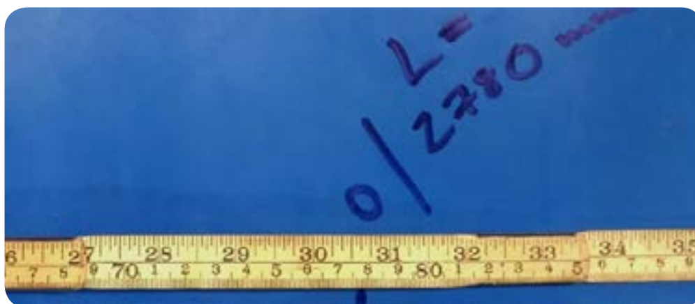
Bild 6 - Slutför mätningen vid startmarkering .....

Fortsätt mäta tills du når startmarkeringen / nollan igen.