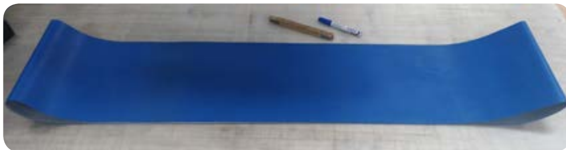
Bild 1 - Material som behövs .....