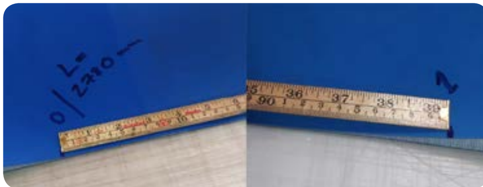
Bild 4 och 5 - Markering av start och första metern .....

Markera utgångsposition med en nolla. Sätt därefter markeringar för varje hel meter som du mäter upp längs bandet.